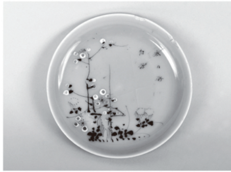
青磁皿（美濃焼） 明治10～20年代 品川区教育委員会蔵