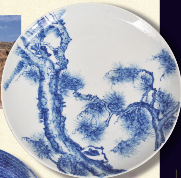
染付大皿(瀬戸焼) 明治11年-瀬戸市蔵