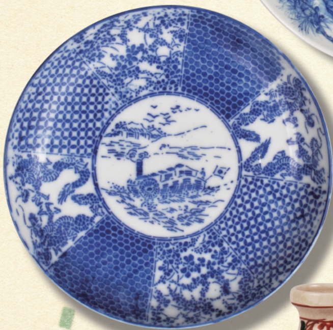
染付皿(美濃焼) 明治23年-個人蔵