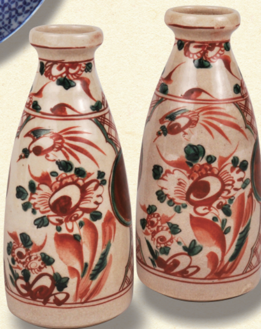
呉州赤絵写徳利(甲山焼) 明治5~25年-愛知県陶磁美術館蔵 (鈴木克明氏寄贈)