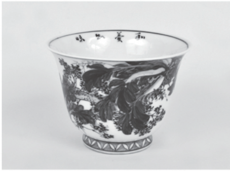
染付鉢（瀬戸焼：川本栞吉・作） 明治8年 瀬戸市蔵