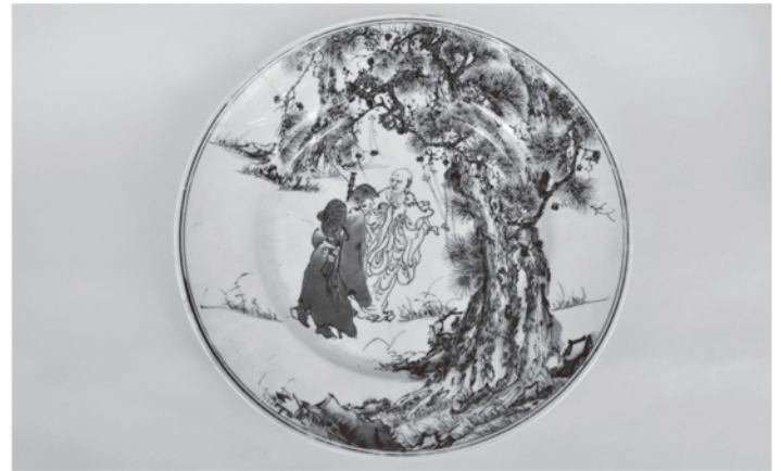
染付大皿（瀬戸焼） 明治20年 瀬戸市蔵

令和3年度からは、4つの時代の最後、「近代」を取り上げます。その第1回目として、本展覧会では、近代前期、19世紀末までを対象とします。幕末の開国により、欧米の技術・文化が日本に流れ込んできました。明治時代に入り、新政府の殖産興業政策がそれに拍車をかけます。また、万国博覧会への参加により、せとやきなどの日本の陶磁器が注目を集め、海外輸出が盛んになっていきます。そのため、瀬戸窯では、輸出用として無文の磁器（白磁）が大量に作られるようになりました。また、染付製品においても、酸化コバルト呉須の輸入や銅版転写による施文など、量産化に向けて急激な舵取りを行っています。このような生産状況を、発掘調査の成果をもとに表します。また、同時期における美濃窯や周辺諸窯の生産体制についてもみていきます。さらに、これらの製品の国内における流通・消費状況についても合わせて概観します。