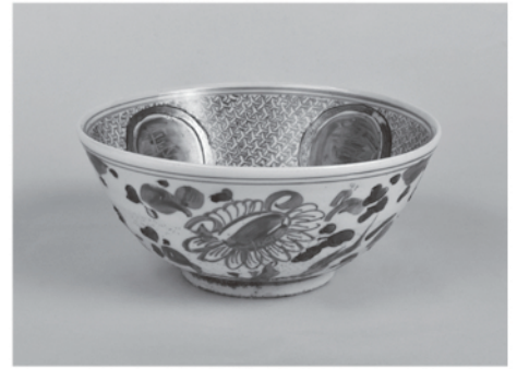
呉州赤絵写鉢（甲山焼） 明治5～25年 愛知県陶磁美術館蔵 （鈴木克明氏寄贈）

公益財団法人瀬戸市文化振興財団は、その前身である（財）瀬戸市埋蔵文化財センターが設立された平成4年から、瀬戸窯を中心とした陶磁器の生産と流通について考古学的な調査・研究と普及啓発活動を進めてまいりました。その中でも、普及啓発活動については、毎年1回の企画展を欠かすことなく開催しており、今年度をもってちょうど30回目となります。企画展では、瀬戸窯の陶磁史をもとに「中世・大窯（戦国・織豊期）・江戸時代・近代」という4つの時代に分け、時代ごとに総合テーマを設定し、それぞれ複数年にわたって開催するという形式をとってまいりました。このように、時代を追って具体的にみていくことにより、「せとやき」の歴史的な変遷や意義をより深く理解していただけたものと考えております。