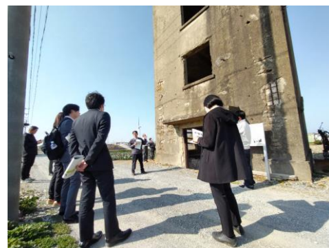
陸軍伊良湖射場跡