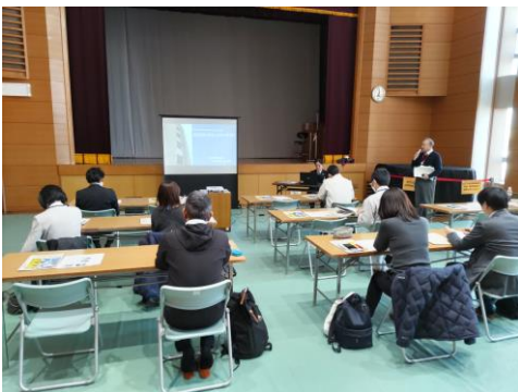
三河地区協議会(田原市)