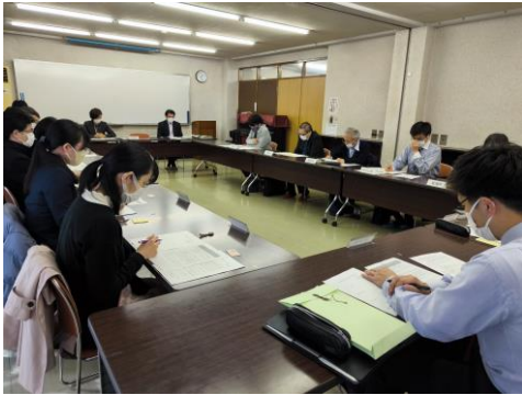
尾張地区協議会(小牧市)